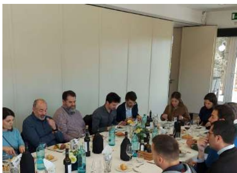
FEM EMPRESA AMB QUOPIAM LA CIBERSEGURETAT A LES EMPRESSES