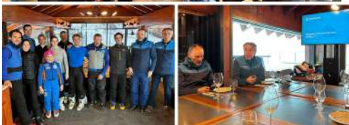
FEM EMPRESA LA GESTIÓ DE GRANDVALIRA