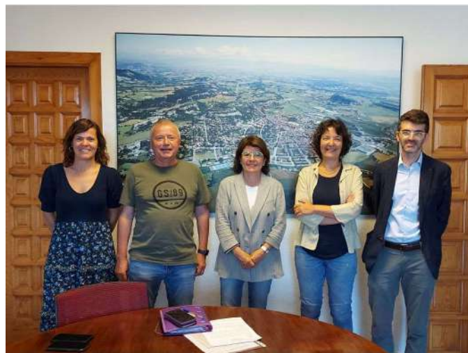
AJUNTAMENT DE TONA VISITES TERRITORIALS A MUNICIPIS

Des del Consell Empresarial d'Osona hem visitat diferents Ajuntaments de la comarca d'Osona, entre ells l'Ajuntament de Vic, Tona, Sant Pere de Torelló, entre d'altres.