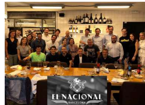
FI DE TEMPORADA - FEM EMPRESA SOPAR EMPRESARIAL A EL NACIONAL