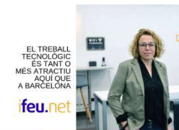
ENTREVISTA FEM DEO TXELL FEU IFEU