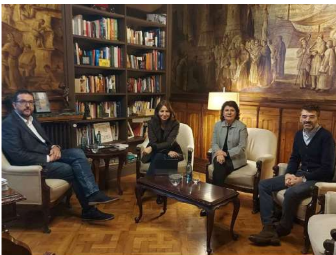
REUNIÓ AMB L'AJUNTAMENT DE VIC CONVERSEM SOBRE VIC I LA COMARCA