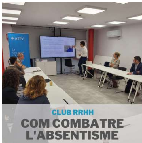
CLUB RRHH COM COMBATRE L'ABSENTISME