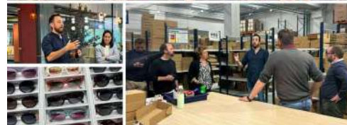
FEM EMPRESA AMB WOODY'S EL SECRET DE LES ULLERES DE FUSTA