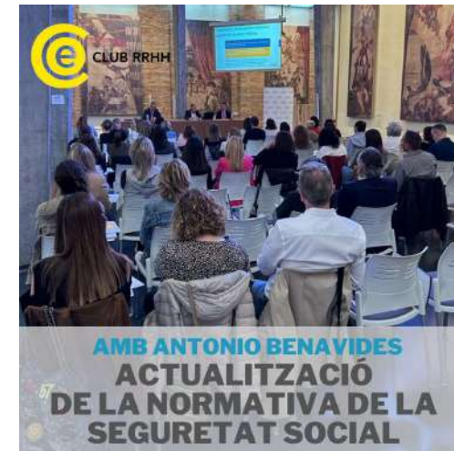
AMB ANTONIO BENAVIDES ACTUALITZACIÓ DE LA NORMATIVA DE LA SEGURETAT SOCIAL