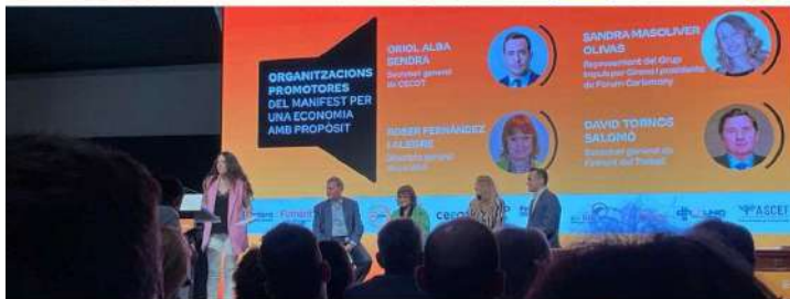
EMPRESSES AMB PROPÒSIT EL CEDO SE SUMA AL MANIFEST RESPON.CAT