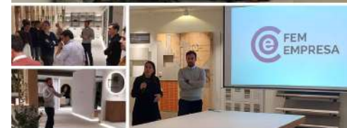
FEM EMPRESA AMB JÒDUL DE TARADELL A TOT EL MÓN