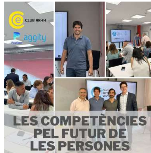
LES COMPETÈNCIES PEL FUTUR DE LES PERSONES