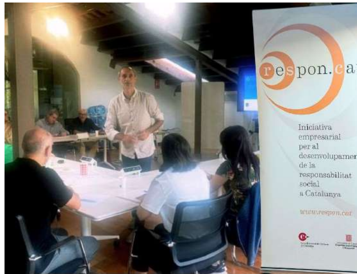
EMPRESSES AMB PROPÒSIT INICIEM LA FORMACIÓ EN RESPONSABILITAT

Des del Consell Empresarial d'Osona som patronal territorial adherida al manifest d'Empreses amb propòsit que organitza Respon.cat.