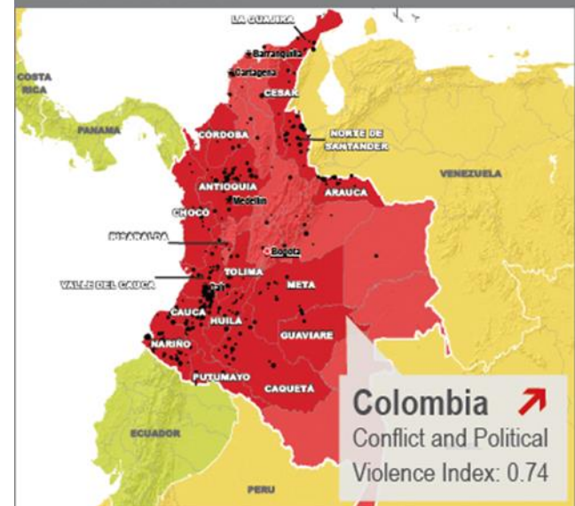
Conflict and Political Violence Intensity Index 2013